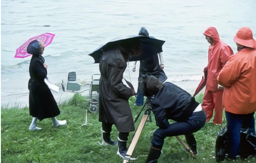
Filmning i kamp mot vädrets makter

Alla var inställda på att idag skulle "det" göras och denna inställning underlättade definitivt filmningen. Allt flöt bra. För att få någon fristad från regnet, som piskade på utifrån fjärden, spände vi upp en stor presenning mellan taken på våra tre bilar. I denna provisoriska boning kunde vi åtnjuta den medhavda matsäcken och montera filmutrustningen. Att överhuvudtaget fundera på ljudupptagning denna dag var ett hån, men kamerablampen fungerade utmärkt som regnskydd. Exponeringsvärde var det aldrig tal om. Vi låg konstant flera bländarsteg under full glugg, men tack vare Kodachromes tolerans, blev tagningarna trots allt lyckade.